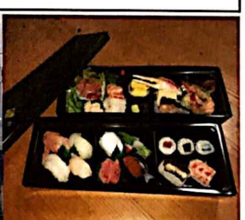
(観光列車“つどい”) (つどい・車内の様子) (寿司の有甚) (写真はイメージです)

旅行代金 (お一人様) 五位堂駅 4,760円 (こども 3,760円) 大和高田駅 4,730円 (こども 3,750円)